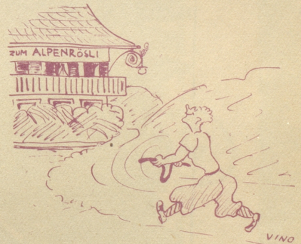
Der Rutengänger: «Mys Rüeli schlaat us, 's hüt sicher öppis Füechts i de Nächli!»

S. M. und der Fürst halten sich dato zur Kur in Kandersteg auf. emka.