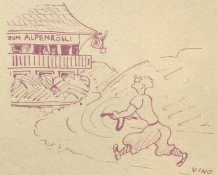
Der Rutengänger: «Mys Rüelli schlaat us, 's hüt sicher öppis Füechts i de Nächli!»

S. M. und der Fürst halten sich dato zur Kur in Kandersteg auf. emka.