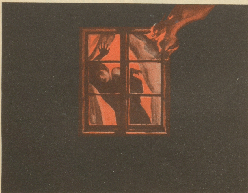
„Feuer breitet sich nicht aus, hast du Minimax im Haus.“

Meieli ist noch nicht ganz stubenrein. Es wird am Morgen gefragt: «Häscht öppe wieder is Bett gmacht?» Da sagt es: «Nei, nei, ich ha nu gschwitzt a dere Schtell!» OLa