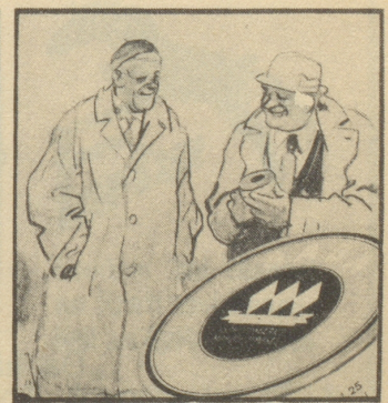
„Ich gehe nie ohne Gaba auf die Reise! Gaba ist die Reiseversicherung gegen Husten und Heiserkeit.“