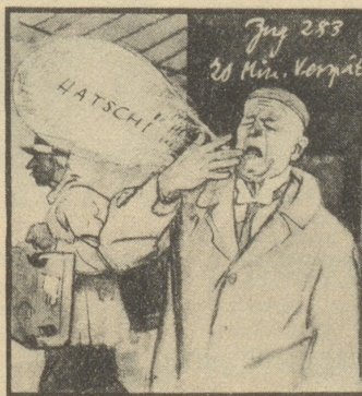
A. „Was? 20 Minuten Verspätung! Mit meinem Herbstkatarrh! Hatschi!“