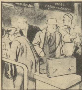
A. „Unerhört! Wieder nur ein Schalter auf, und es zieht!“ B. „Immer mit der Ruhe! Drüben wird der zweite aufgemacht.“

Mann: «Wie wär's mit einer Zuckerrange für zwölf Personen?» dy