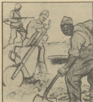
Hacken, Picken und Schaufeln, das ist nun sein Tagewerk, seit er an der Grenze steht.