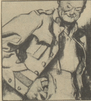
Zum Glück legt die Mutter in jedes Wäschesäcklein auch eine Dose Gaba-Tabletten.