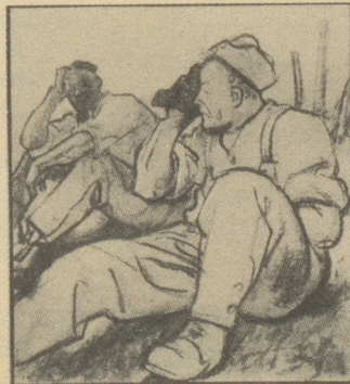
Natürlich kommt man bei der ungewohnten Arbeit ins Schwitzen, und bei dem rauhen Winterwetter ist es dann zu einer Erkältung nicht mehr weit.