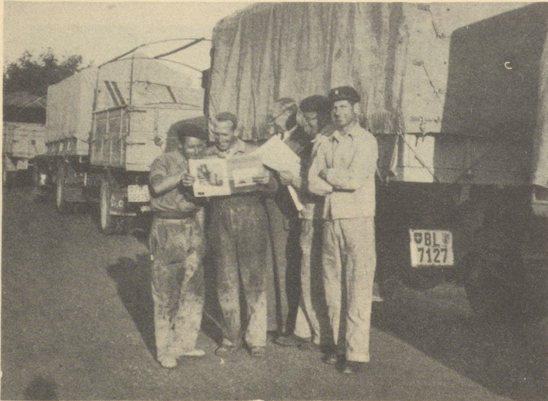
Ein Bildchen von der Schweizer Autokolonne Portugal-Spanien