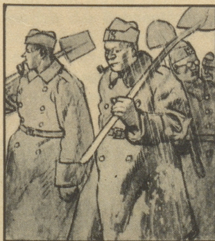
Müde von der ungewohnt harten Arbeit kehren unsere Soldaten ins Kantonement zurück.

Das Maultier spricht gern von seinem Verwandten, dem Pferde; niemals aber von seinem Vetter, dem Esel.