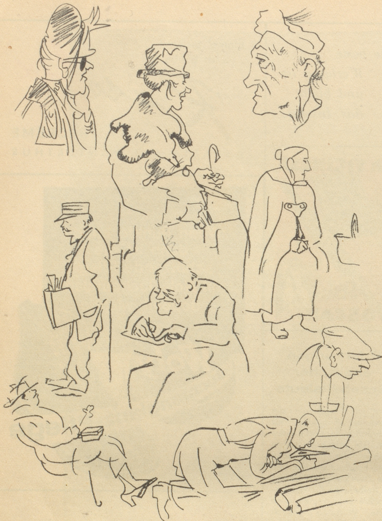
Aus Rickenbachs Skizzenbuch