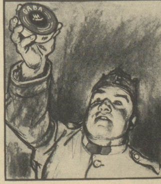
— „Schindeln nicht grad, aber Gaba. Da nimm, dann kriegst Du keinen Schnupfen, wenn's auch zieht.“