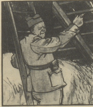
„Da hat's ja Löcher im Dach! Hat keiner ein paar Schindeln im Sack?“