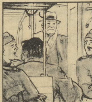
„Gut, dass sie noch so fröhlich singen mögen, wenn's auch andere Lieder sind als zu unserer Zeit“, denkt Herr Bürger.