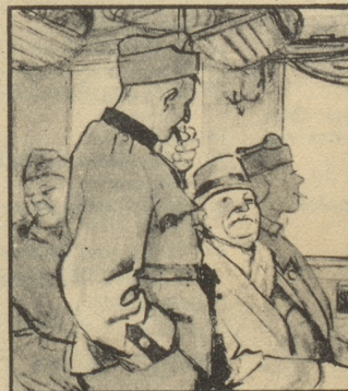
„Mich wundert nur, dass Ihr in dem Rauch singen könnt, ich werde stockheiser.“ – „Dafür nehmen wir Gaba, das lernt man beim Militär.“