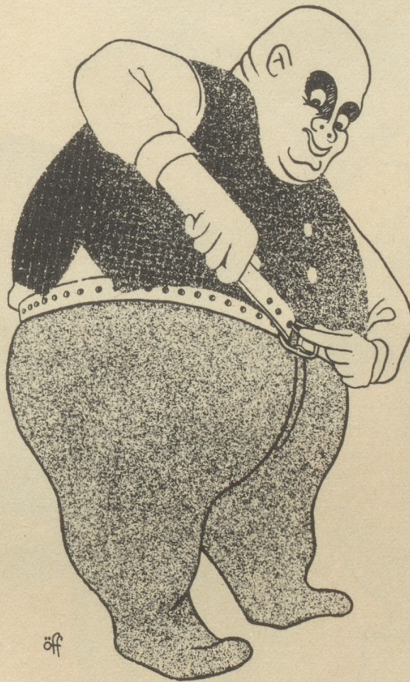
Enger schnallen! Namentlich döt, wo's no mengs Löchli hät!

Fritzli: «De Vatter hät zwor gseit, i dörf's nöd säge ... aber drü Tübli hät er geschter abegschosse, wo dr Noch­bur furt gsi isch!» Kari