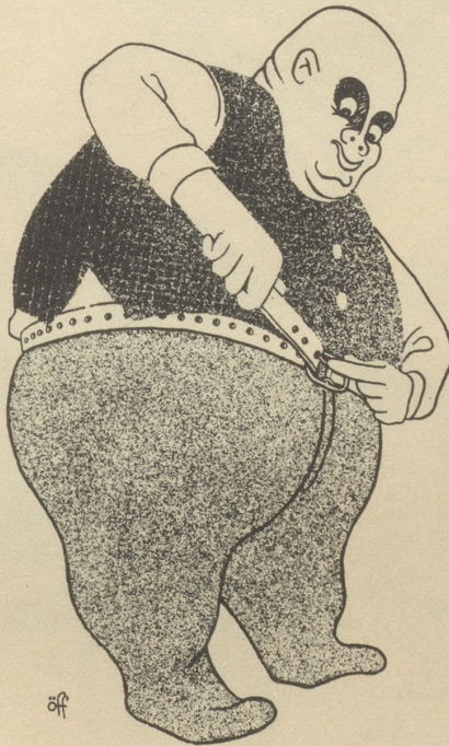
Enger schnallen! Namentlich döt, wo's no mungs Löchli hät!

Fritzli: «De Vatter hät zwor gseit, i dörf's nöd säge ... aber drü Tübli hät er geschter abegschosse, wo dr Noch­bur furt gsi isch!» Kari