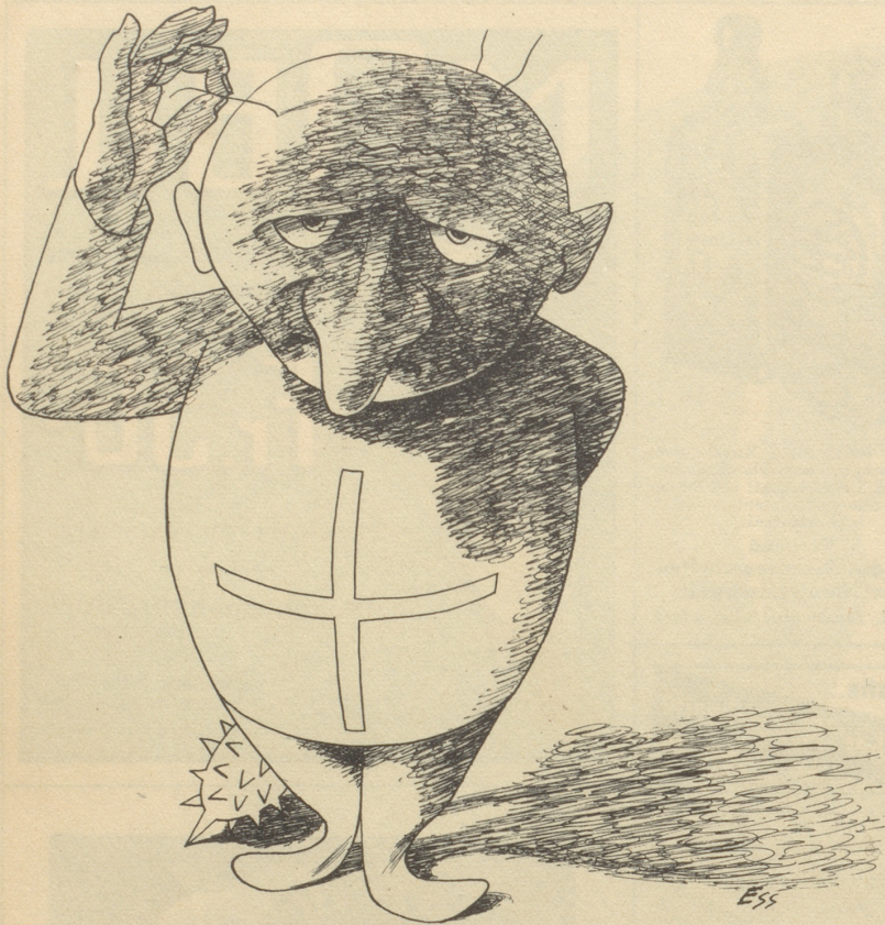
Die verbotene „Nationale Front“ ist unter dem Namen „Eidgenössische Sammlung“ wieder auferstanden.