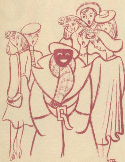
Nach den Winterferien Jeder achte Schweizer ein Luis Trenker.