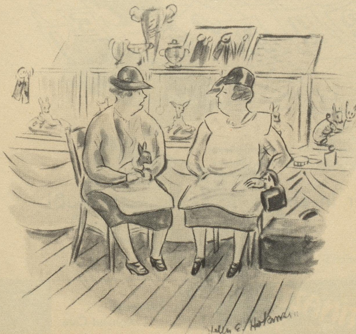
„Glaubezi würkli es Roß wär ahänglicher?“ (New Yorker)

«Wenn hesch de agfange?» erkundigt sich der Robeli.