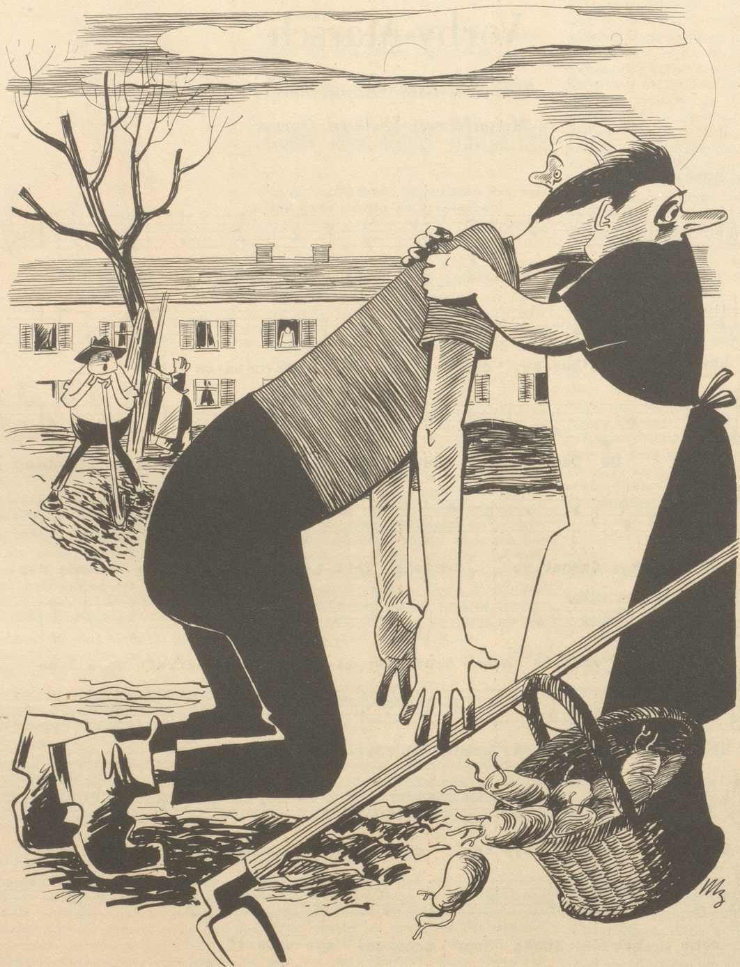
Der Anfänger „Emilie — — en Wurm!“