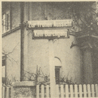
Die laht sich meini nüd gern aaluege.