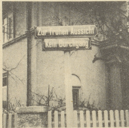
Die laht sich meini nüd gern aaluege.

P.S. des «Nebi»: Cher vieux Bâlois! Heusler und nit «Häusler», perse, Si händ vollkomme rächt und mir, was doch wais Gott au hätte solle wisse, nous en sommes navrés! Aber will