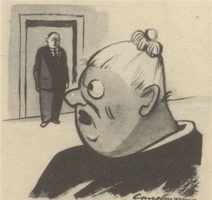
Emmeli, bisch böš?“