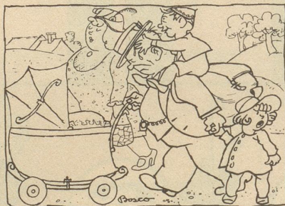
freut me sich uf d'Erholig am Sunntig!