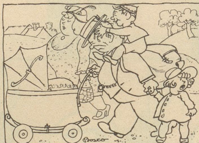
freut me sich uf d'Erholig am Sunntig!