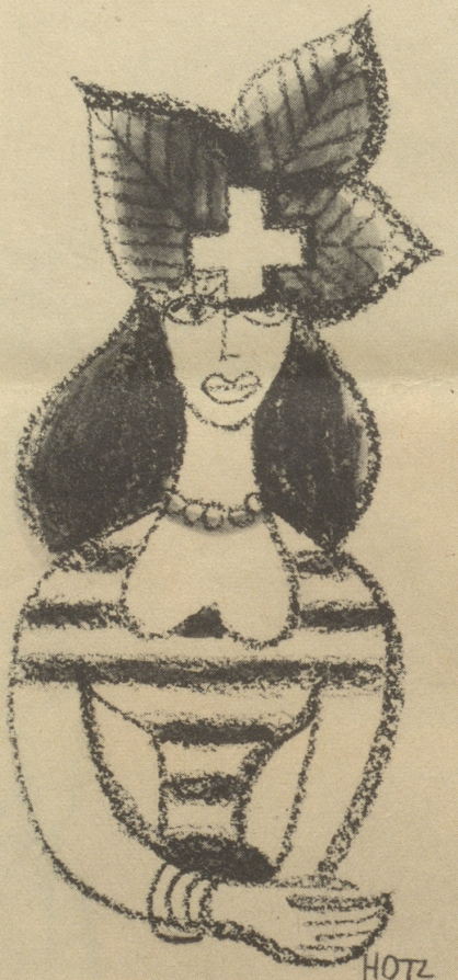
Vorschlag für das Frauen-Sport-Abzeichen