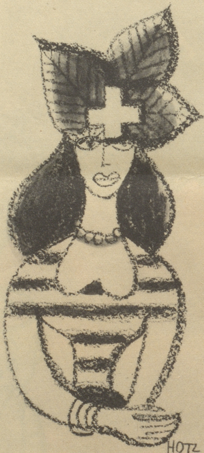
Vorschlag für das Frauen-Sport-Abzeichen

«Beuge dich doch nicht so weit vor, Liebster!» F. H.