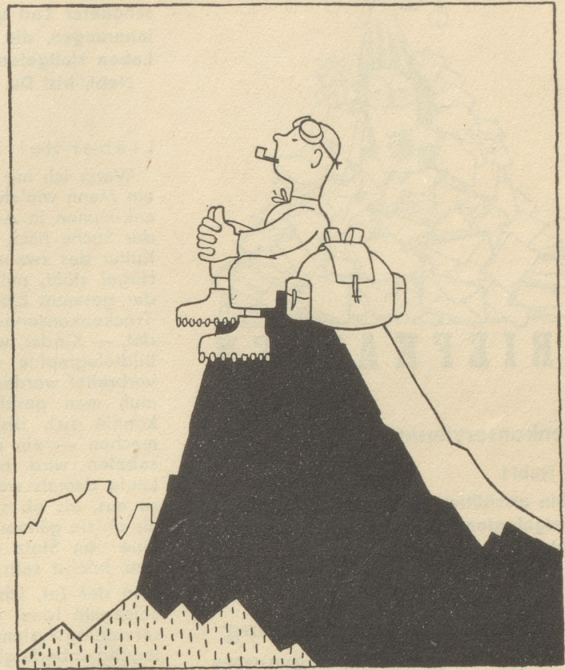
Der Mensch und der Berg