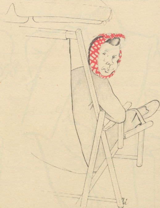
„I wett, i hett's weniger schö...“