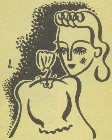
Das Blüseli aus dem „gepflegten“ Haar Allpot mues mes wäsche, färbe u. onduliere.