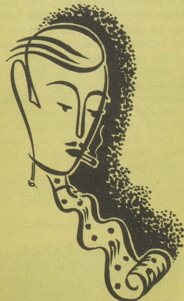
Die Krawatte aus Naturlocken da nützt alls bügle nüt!