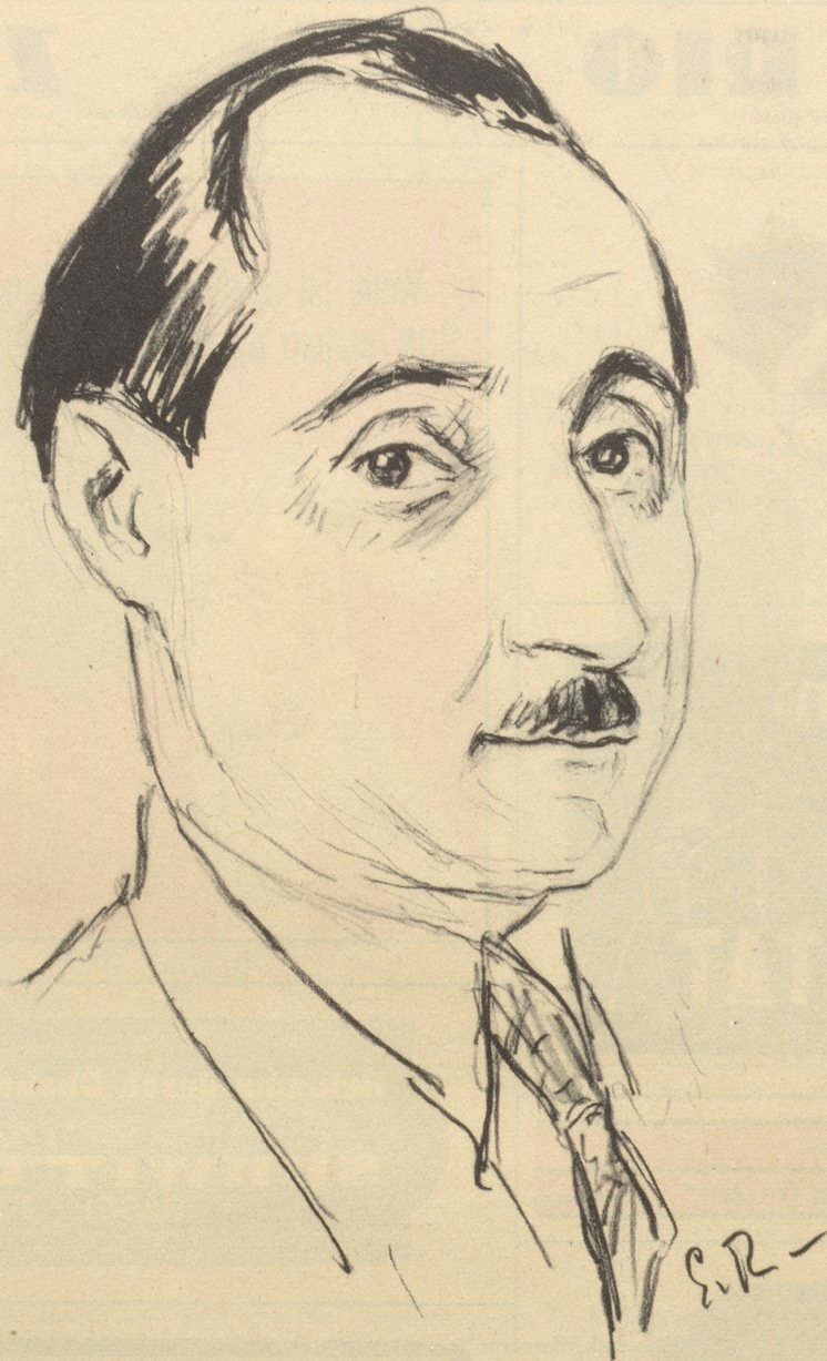
Skizzen aus dem Bundeshaus: