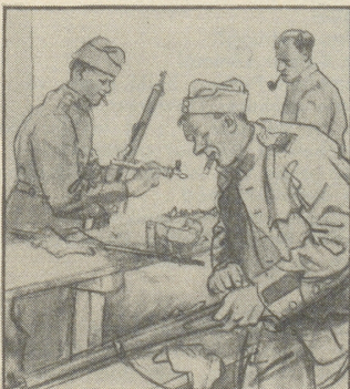
Der Soldat im Grenzschutz ist der reine Immerbrenner; beständig hat er einen Stumpfen im Mund, um wach und munter zu bleiben.

Haben Sie den erstaunlichen, farbenfrohen Monumental-Märchenfilm der United Artists angesehen, der die Träume unserer Kindheit wieder lebendig werden läßt? Wer eine lebhaftere Phantasie sein eigen nennt, verläßt das Kino mit dem Gefühl, so und nicht anders habe er sich den Hintergrund der Märchenwelt des Orients vorgestellt. Der fliegende Teppich, der am Schluß den Held des Films entführt — in Zürich kauft man Orient-Teppiche bei Vidal an der Bahnhofstraße — ist übrigens ein Prachtstück, den sich jede Beschauerin gern in ihr Heim wünscht.