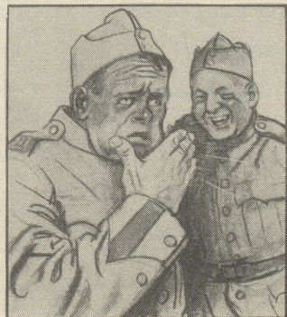
Natürlich spürt man's bald im Hals, und den lästigen Raucher-Katarrh wird man überhaupt nicht mehr los.