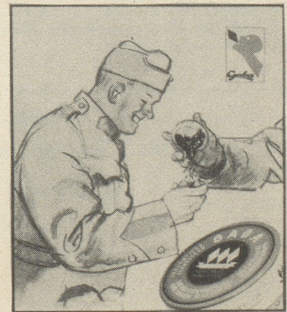
Gaba, auch im Grenzdienst ein gutes Mittel gegen den lästigen Raucher-Katarrh.