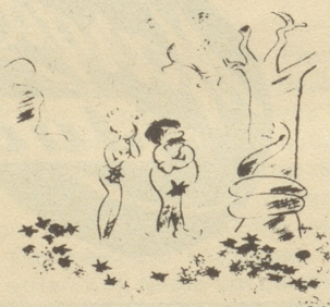
Schrecklich, Adam, es wird Herbst, die Blätter fallen — was ziehen wir da nur an? (Das illustrierte Blatt)

Besonders das Pferd wird streng bestraft werden! Warum hat er auch die Bahnlinie überfahren wollen?