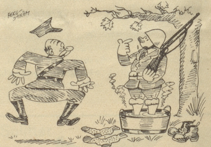
«Ich bin erkältet, Herr Hauptmann.»