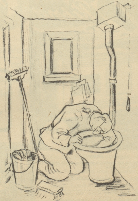
Befehl an Füsilier Rabinovitch: «Aborte putzen!»