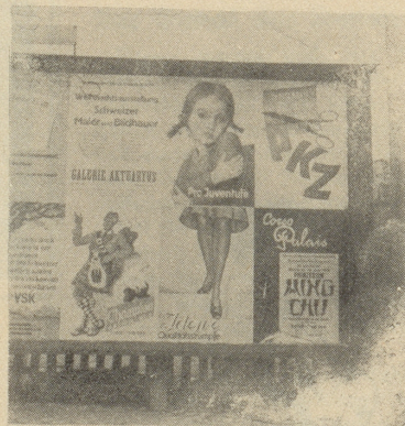
Dem Chind geht's meini scho e chli besser!

Die Thurgauer disponieren auf lange Sicht!