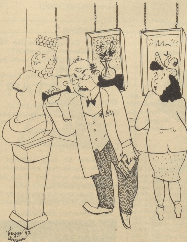
Der Arzt in der Ausstellung