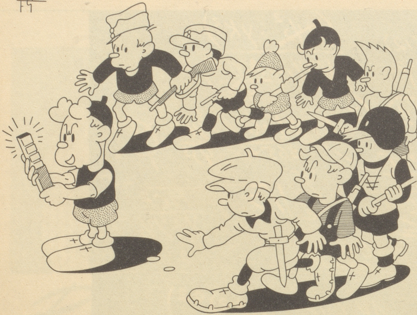
Walterlis Chocolate und der Zangenangriff