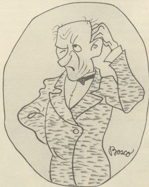
Des Pessimisten: „Wer weiß, was jetzt wieder chunt?!“