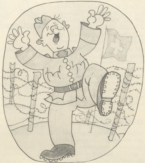
Des Soldaten an der Grenze: „Juhui! Hei!!“