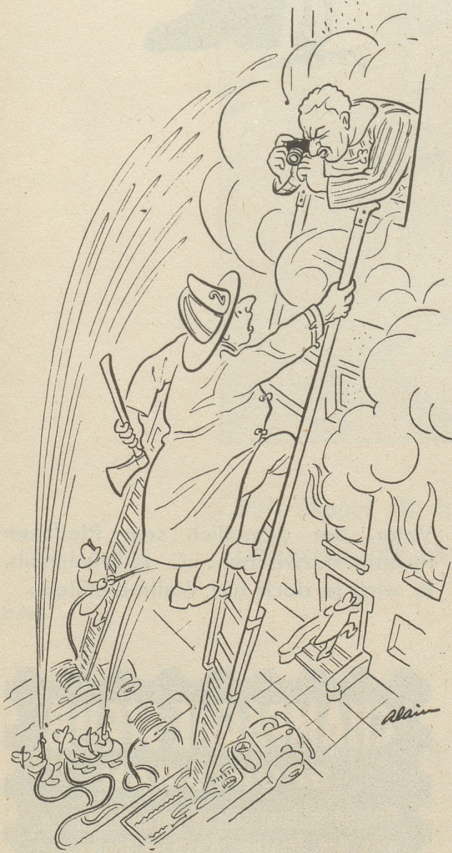
Der Bildreporter Amerikanischer Humor

Heut ist's um dieses Glück geschehn. Wenn's keinen Platz hat, muß man stehn, ob einem auch bei den Beschwerden die armen Knie schnappprig werden. pa.