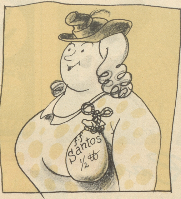
oder es Säckli voll gröschtetete Kafi