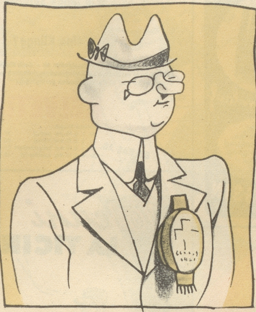
Es Stuck prima Toiletteseupfe