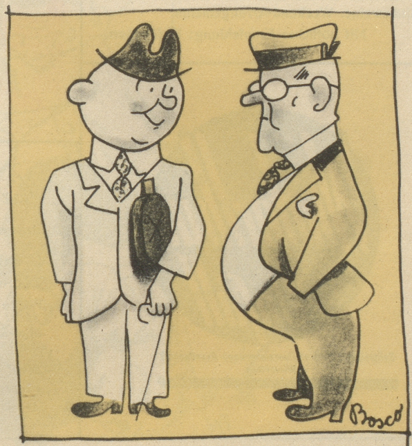
oder es Brikett

„Das wär doch säuglatt derigi Abzeiche!“ „Dumms Züg, usgrächnet Sache, wo so knapp sind.“ „He, me sammet s' ja nachher doch wieder ii!“