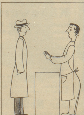
«s' tuet mr leid, Herr.»