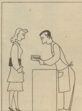
«o pittü gern Frölain!»