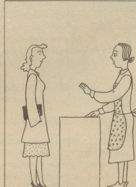
«s tuet mr leid Frölain.»