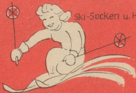
Ski-Socken u. Handschuhe

überhaupt alles aus Wolle oder Mischwolle filzt nicht und geht nicht ein, wenn es SUN-Wolle ist