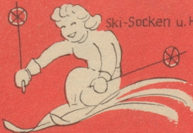
Ski-Socken u. Handschuhe

überhaupt alles aus Wolle oder Mischwolle filzt nicht und geht nicht ein, wenn es SUN-Wolle ist