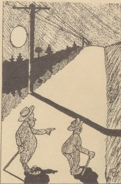
— Du — hup — hier müssen wir — hup — darüberspringen ... Söndagsnisse-Strix