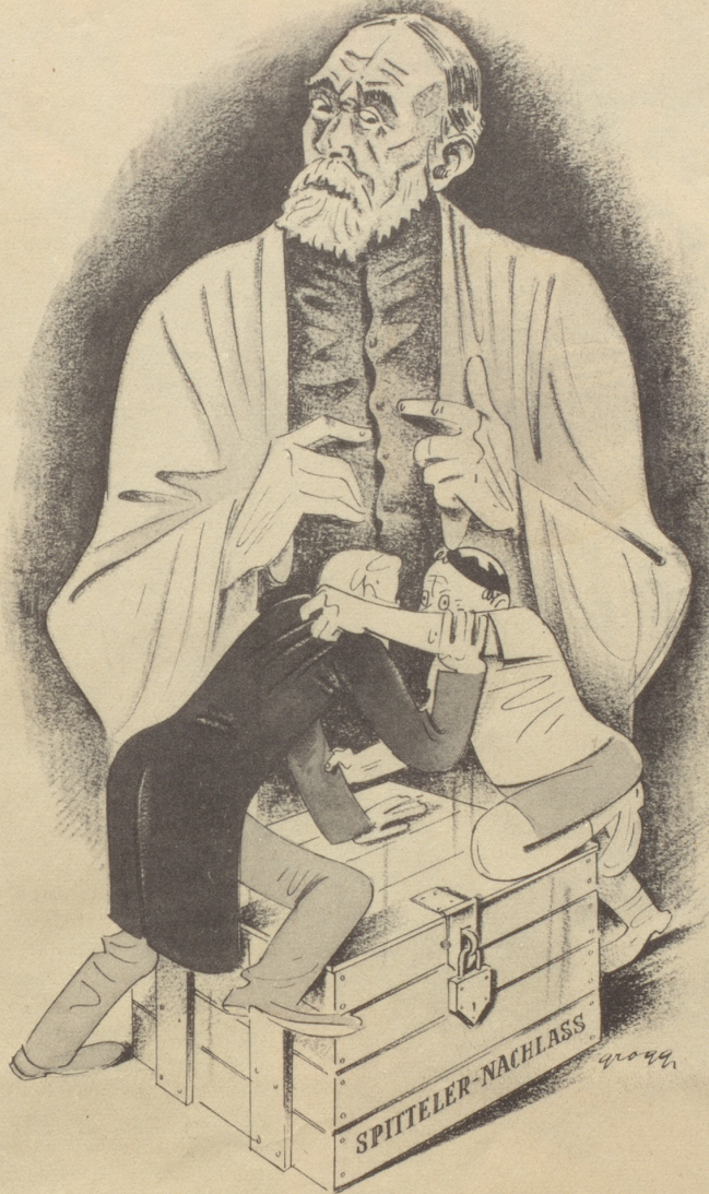
Zum neu entbrannten Streit um den Spitteler-Nachlaß

„Nein, liebe Freunde, das habe ich bestimmt nicht gewollt!“