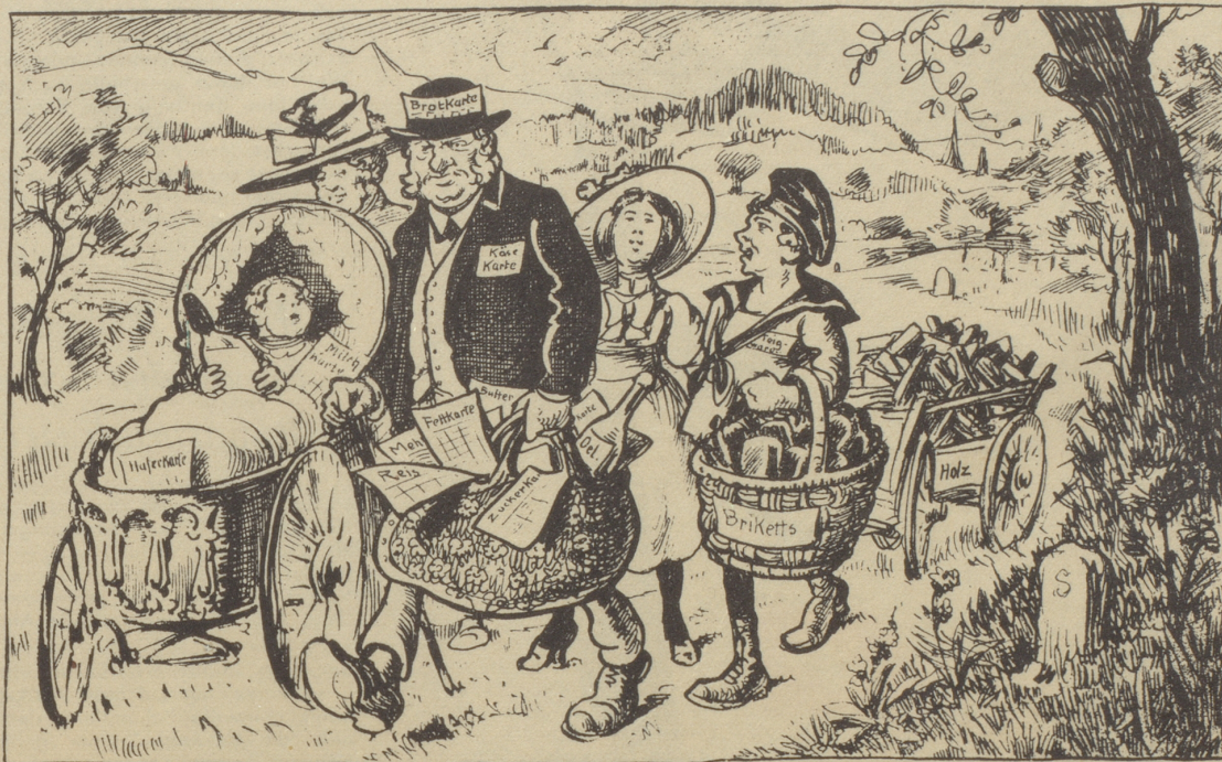
Aus dem Nebelspalter vom 29. Juni 1918