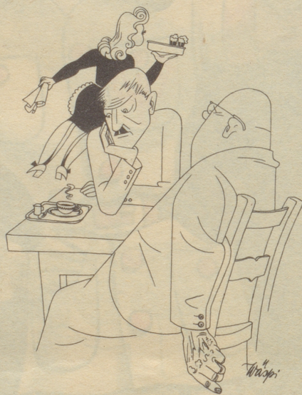
«Was trinksch du da, Tee oder Kafi?» «Frög Zerwierfotchter!»

Er: «Ach weisch, de Bund hät sich verrächnet, drum müend mir em jetz hälfe.» Zü.