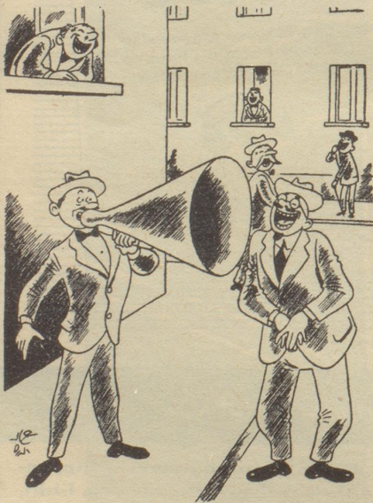
«Man kann die neuesten Nachrichten nicht laut genug sagen.» (Marc' Aurelio, Rom)

«Wohltaetigkeit ist das Ersaufen des Rechts im Mistloch der Gnade.» (Pestalozzi.)