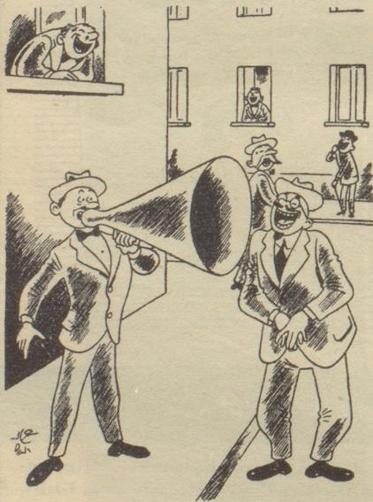
«Man kann die neuesten Nachrichten nicht laut genug sagen.» (Marc' Aurelio, Rom)

«Wohltaetigkeit ist das Ersaufen des Rechts im Mistloch der Gnade.» (Pestalozzi.)