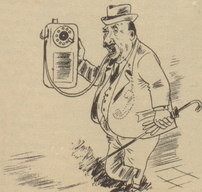
Der Bauchredner hat es nicht leicht. (Marc' Aurelio)