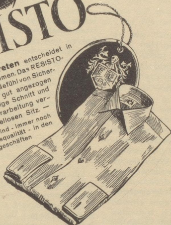
RESISTO, das klassische Hemd des eleganten Herrn

Das sichere Auftreten entscheidet in allem was Sie unternehmen. Das RESISTO-Hemd gibt Ihnen das Gefühl von Sicherheit, weil Sie darin gut angezogen sind. Der erstklassige Schnitt und die sorgfältige Verarbeitung verbürgen einen tadellosen Sitz. — Resisto-Hemden sind — Immer noch in guter Vorkriegsqualität — in den führenden Fachgeschäften erhältlich