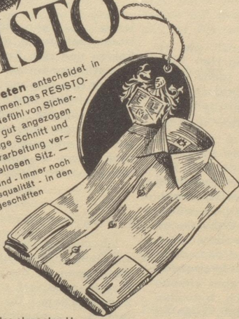
RESISTO, das klassische Hemd des eleganten Herrn

Das sichere Auftreten entscheidet in allem was Sie unternehmen. Das RESISTO-Hemd gibt Ihnen das Gefühl von Sicherheit, weil Sie darin gut angezogen sind. Der erstklassige Schnitt und die sorgfältige Verarbeitung verbürgen einen tadellosen Sitz. — Resisto-Hemden sind — Immer noch in guter Vorkriegsqualität — in den führenden Fachgeschäften erhältlich