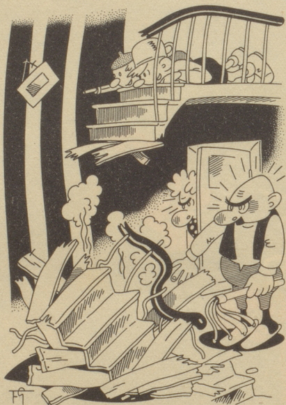
«So etz hämmer eusen Brückekopf errichtet und em Vatter jedi Verbindig abgeschnitelt!»

Nach der Abendtafel wurde der Geiger gebeten, ein kleines Musikstück zum Vortrag zu bringen. Paganini willfahrte diesem Wunsche, griff aber jede fünfte Note falsch. Keiner der darüber höchst verwunderten Gäste verlor ein Wort darüber. Nur der Hausherr fragte