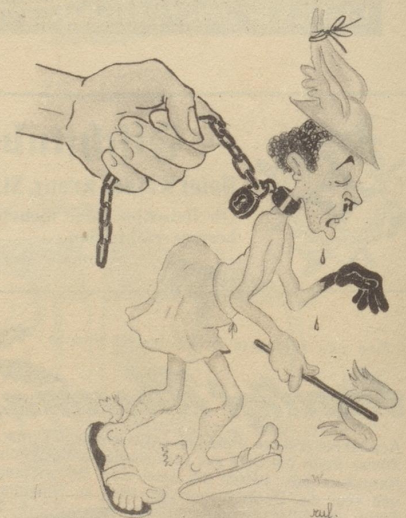
Der schwarzhandige Merkur

Eine Dame, wenn sie «Nein» sagt, meint sie «Vielleicht», wenn sie «Vielleicht» sagt, meint sie «Ja» — und wenn sie «Ja» sagt, dann ist sie keine Dame. hamo