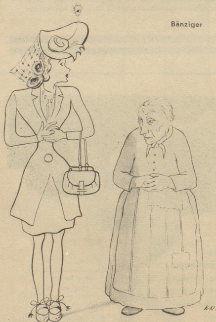
Also e bitzeli findt me sich doch na!

Genf. Die Veranstaltung «14 Tage der Eleganz» schloß bei 84,000 Franken Einnahmen und 116,000 Franken Ausgaben praktisch mit einem Defizit von 32,000 Fr. Da aber Stadt und Private die Sache subventionierten, bleibt ein Ueberschuß von 23,500 Franken, von dem 8355 Franken für Armienzwecke Verwendung finden.