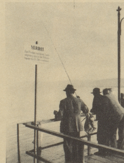
Idyll am Zürisee (Auf der Tafel steht: Das Fischen von diesem Landungssteg aus ist bei Polizeibüße bis zu Fr. 50.— verboten.)

In der «Eintracht» gehen die Wogen der Diskussion hoch. Hohe Preise — hohe Löhne, niedrige Preise — niedrige Löhne, das sind die beiden Meinungen die mit Vehemenz aufeinanderprallen. — Schließlich fragt einer der Streit-